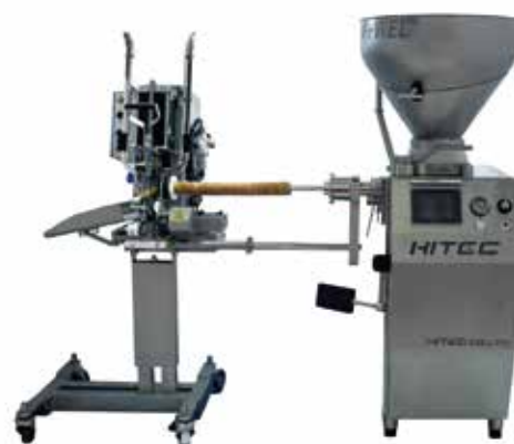
【接続例】 充填機接続式ダブルクリッパー+真空定量充填機スタッフウェル51