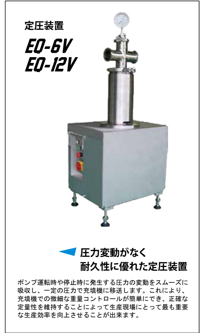
定圧装置 EO-6V EO-12V

リリーフバルブタイプ ハイテックでは定圧運転のため、SPS-Vシリーズにリリーフバルブタイプをご用意しており、低価格モデルとしてご利用いただけます。