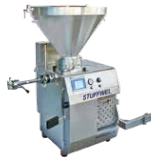
◀ STUFFWEL 219