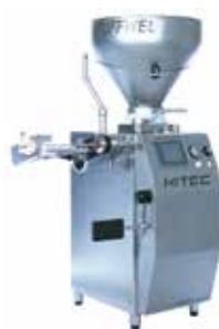
◀ STUFFWEL 51