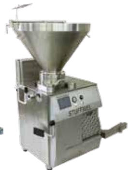
◀ STUFFWEL 222