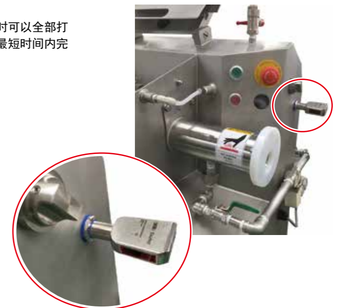
肠衣收集箱的背面