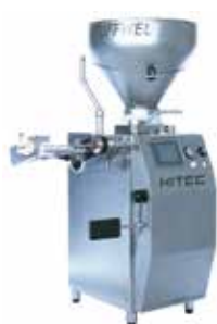
◀ STUFFWEL 51