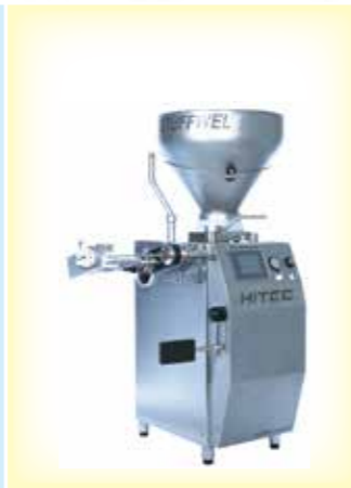
◀ STUFFWEL 51