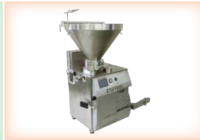
◀ STUFFWEL 222