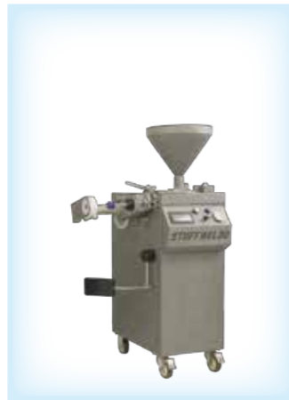
◀ STUFFWEL 30