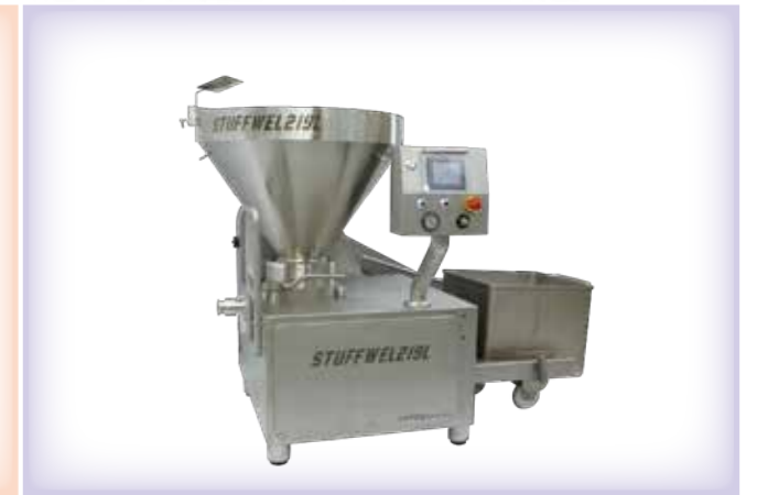
◀ STUFFWEL 219L