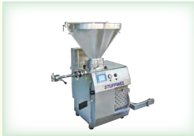
◀ STUFFWEL 219