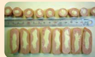
18号纤维素肠衣，5节的样本