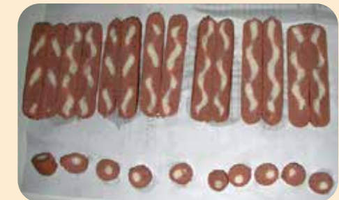
20号纤维素肠衣，10节的螺旋状充填的样本