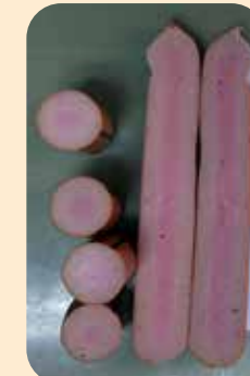
20号胶原蛋白肠衣，掺入麻辣酱肉糜的样本