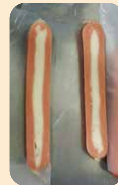
25号纤维素肠衣的样本