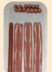
25号纤维素肠衣，32节的样本