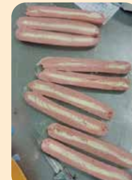
25号纤维素肠衣的样本