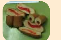
20号胶原蛋白肠衣，草莓酱充填样本