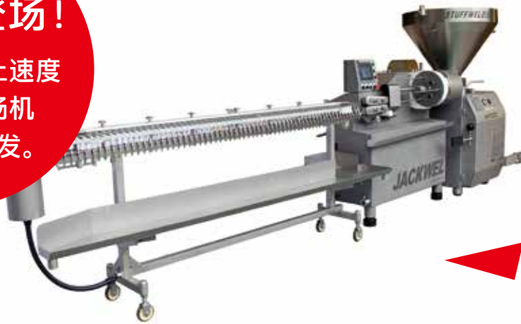
香肠高速定长定量充填机