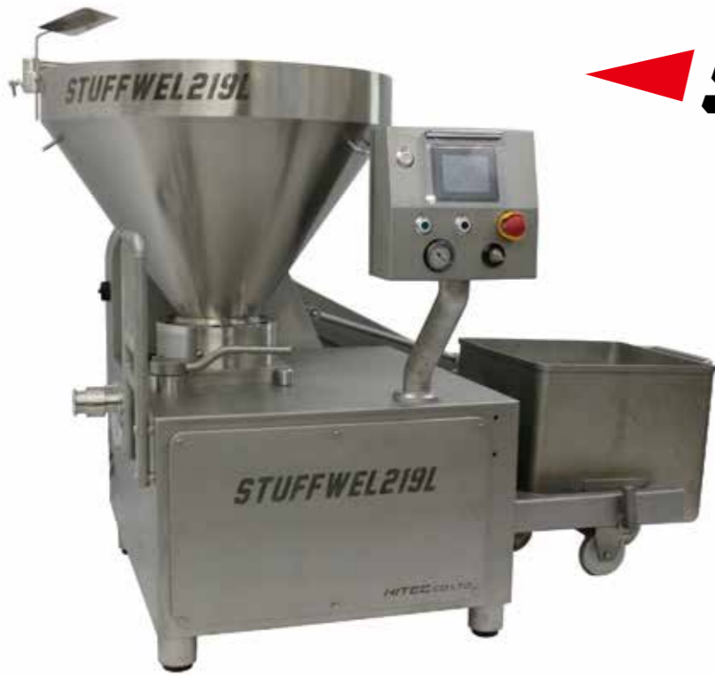
低座式食品真空输送泵