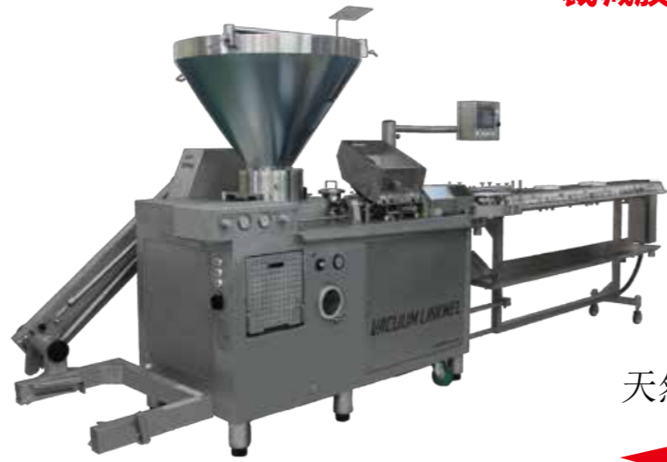
天然人工肠衣香肠真空高速定长定量充填机